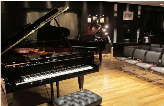
使用ピアノ：ベーゼンドルファーModel290 インペリアル (97鍵)